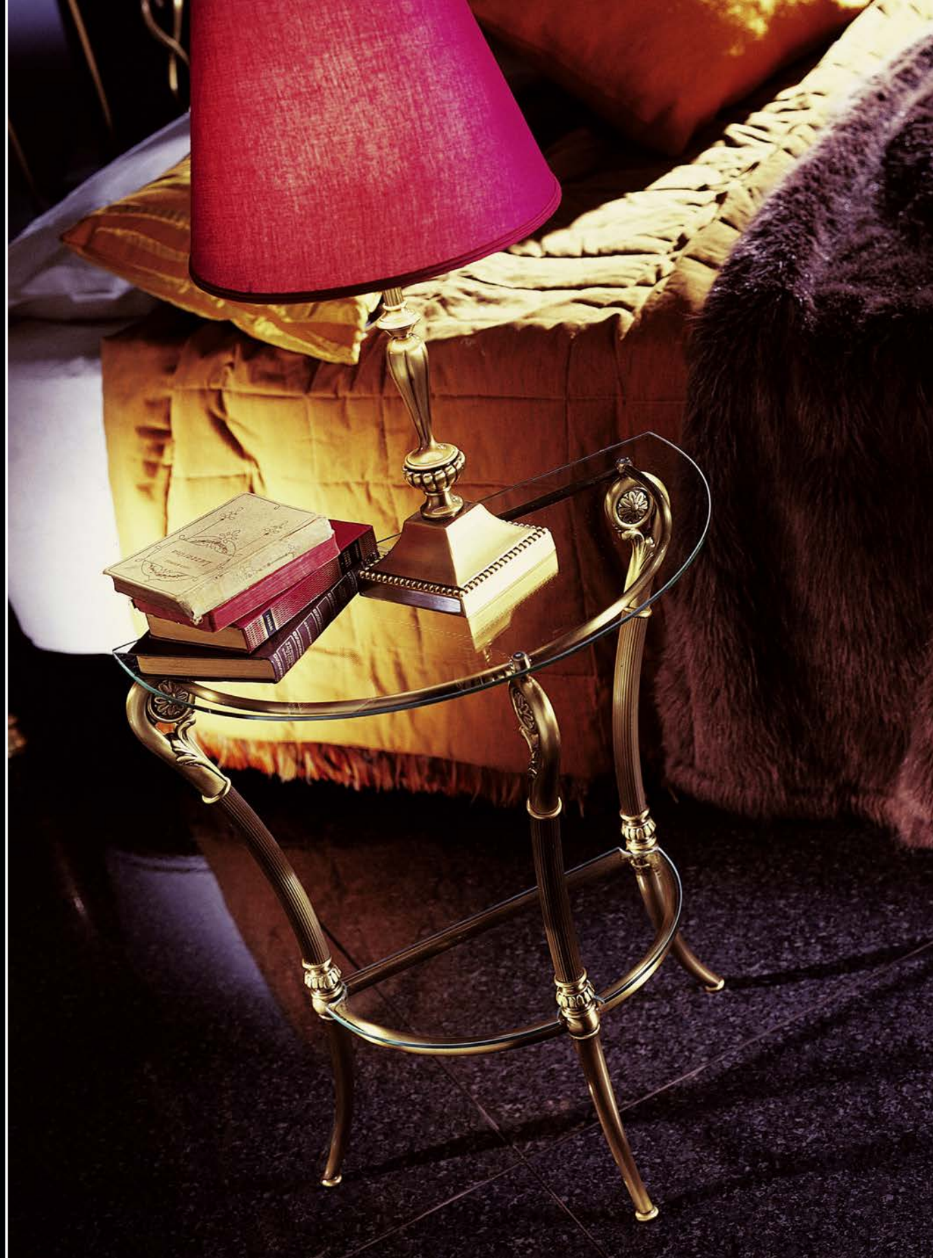
Lunaria Finitura bronzo