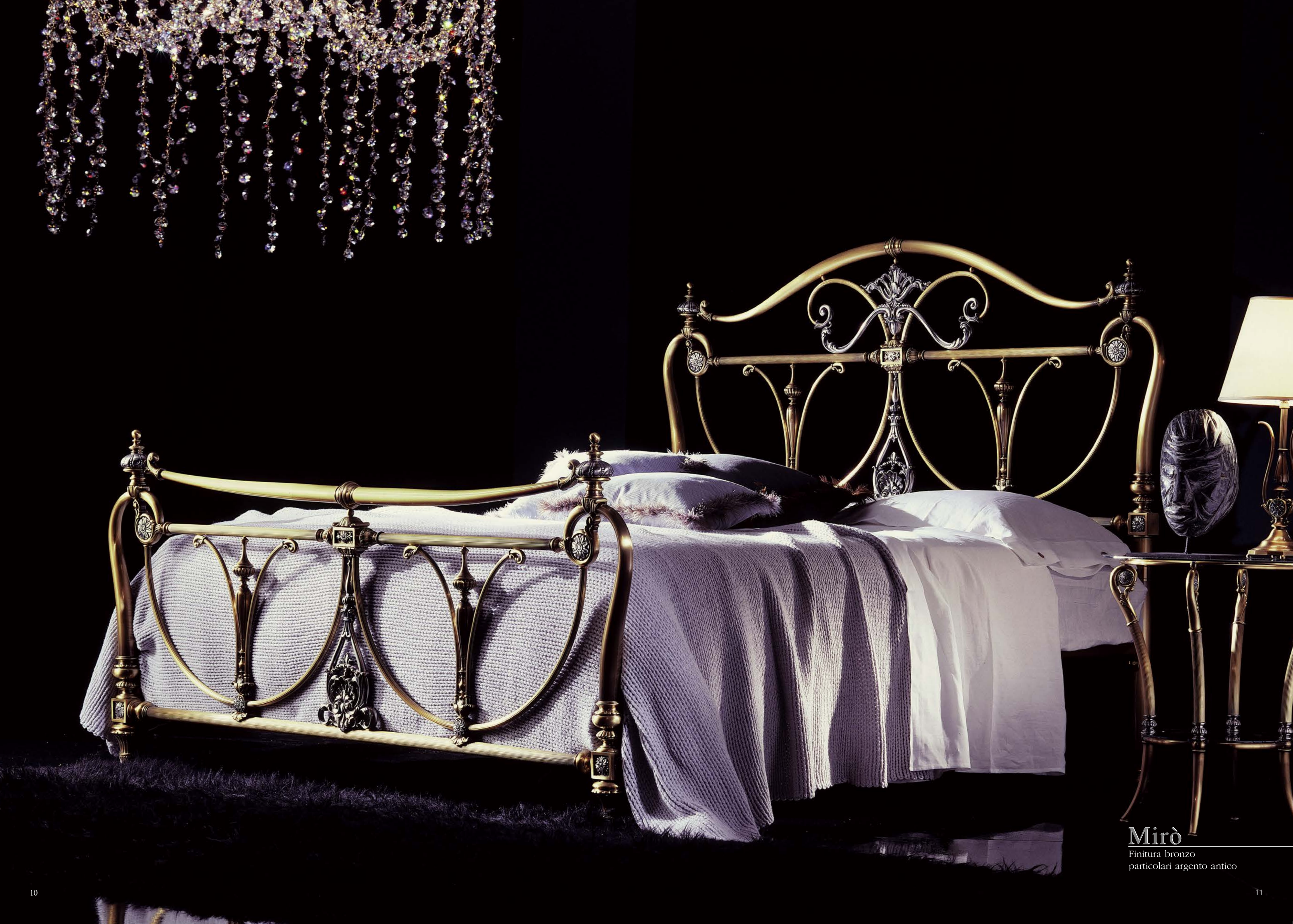
Mirò Finitura bronzo particolari argento antico